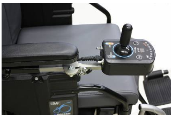
右取付 通常操作位置

電動車いすのジョイスティックを車いすの外側に折り曲げることができる金具です トランスファー(移乗)が行いやすく、テーブルへもしっかり寄り付くことができます 通常操作位置はガタが限りなく少なくジョイスティックをしっかり保持します ロック解除レバーを押し倒すとロックが解除され同時に車いすの外側に折り曲げることができます ジョイスティックを元に位置に戻せば自動でカチットとロックがかかります 通常操作位置以外には位置決め機能はありません