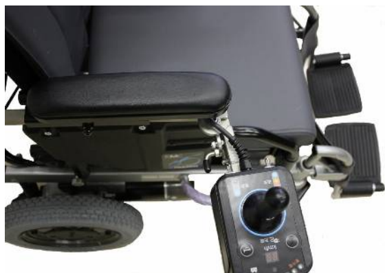
右のロック解除(フリー状態)