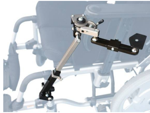
左取付 開いた状態