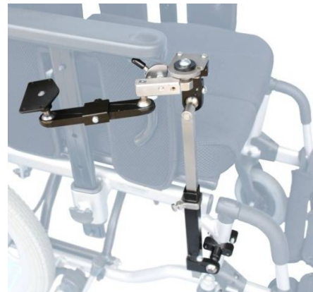
右取付 開いた状態