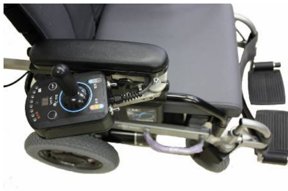
右のロック解除(折り曲げ限界)