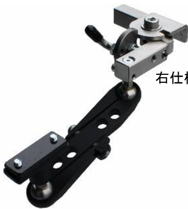
右仕様 右折り曲げ