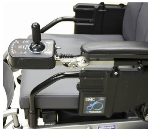
左取付 通常操作位置