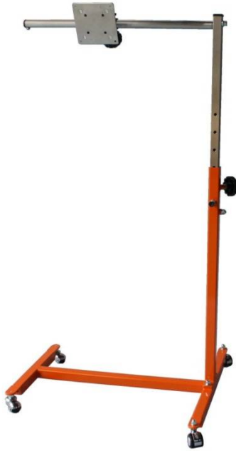
H型液晶用 オレンジ

パンツテル 液晶用はベッドに寝た姿勢で液晶ディスプレイを見られるように保持し高さや角度を調整するものです H型フレームとU型フレームの選択にはベッド下の条件や介助時の取り回しなどをご考慮のうえお選びください