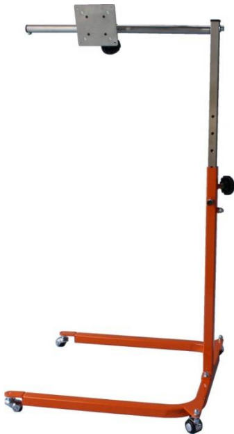
U型液晶用 オレンジ