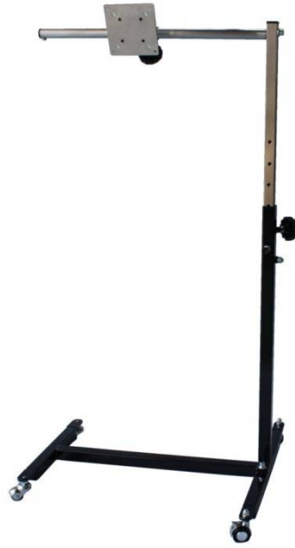
H型液晶用 ブラック