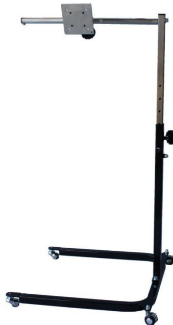
U型液晶用 ブラック