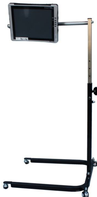
U型パネル型伝の心用 ブラック