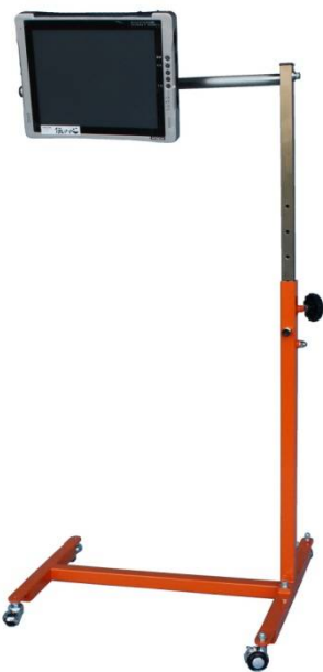
H型パネル型伝の心用 オレンジ

パンツテル パネル型伝の心用はベッドに寝た姿勢で パネル型伝の心を見られるように保持し高さや角度を調整するものです H型フレームとU型フレームの選択にはベッド下の条件や 介助時の取り回しなどをご考慮のうえお選びください