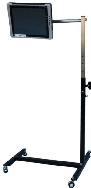
H型パネル型伝の心用 ブラック