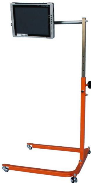
U型パネル型伝の心用 オレンジ