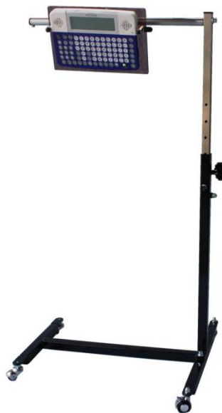
H型ペチャラ用 ブラック