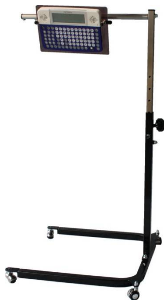
U型ペチャラ用 ブラック