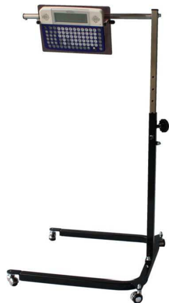
U型ペチャラ用 ブラック