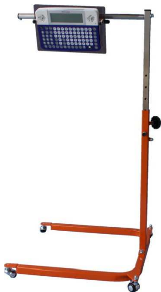
U型ペチャラ用 オレンジ