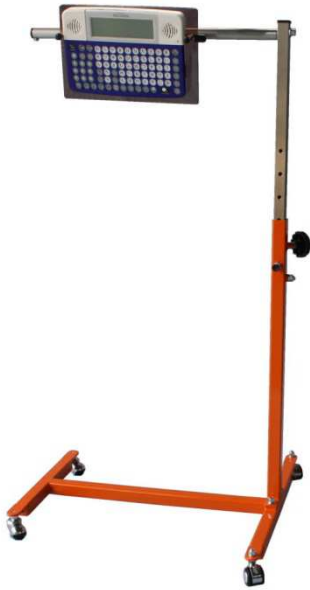
H型ペチャラ用 オレンジ

パソツテル ペチャラ用はベッドに寝た姿勢でボイスキャリアペチャラを見られるように保持し高さや角度を調整するものです。シンプルで取付簡単 H型フレームとU型フレームの選択にはベッド下の条件や 介助時の取り回しなどをご考慮のうえお選びください