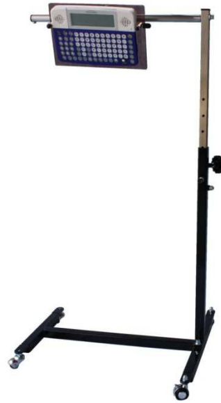
H型ペチャラ用 ブラック